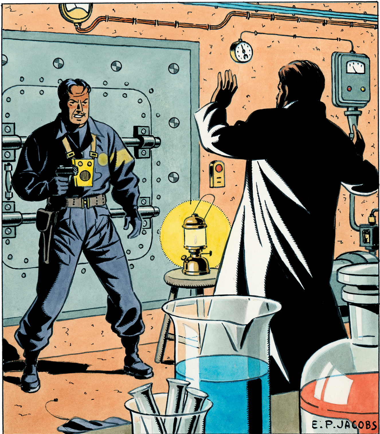
Visuel de la digigraphie accompagnant le livre